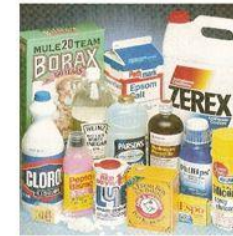
Productos químicos de uso cotidiano en el hogar